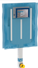
Imagen de ejemplo